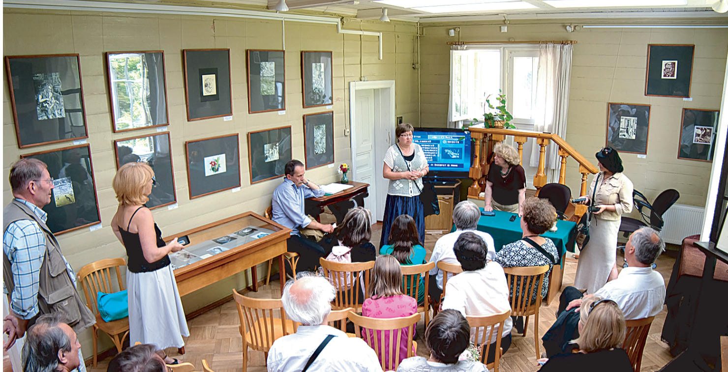
Выставка продлится до 5 сентября.