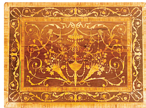
Столик в стиле барокко.