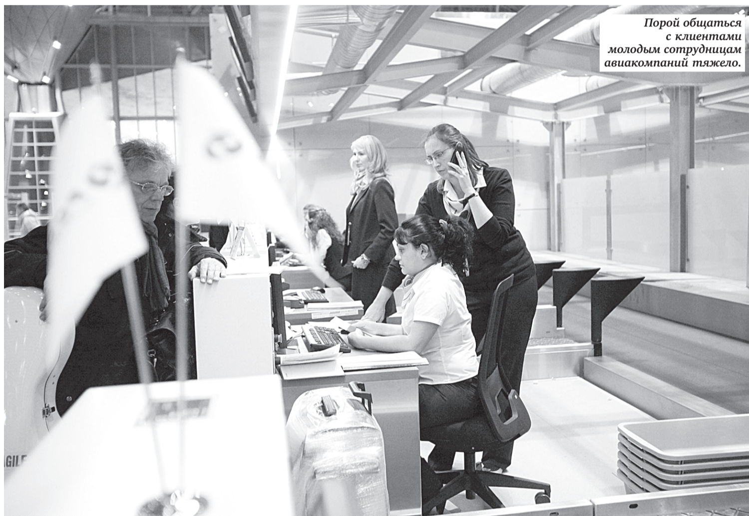
Порой общаться с клиентами молодым сотрудницам авиакомпаний тяжело.

Минтранс предлагает привязать объем выплаты при сверхбронировании к количеству времени, которое пассажиру придется провести в ожидании следующего рейса. Если ожидание продлилось от 2 до 6 часов, размер компенсации составит 12 тысяч рублей; от 6 до 12 часов — 18 тыс. руб. Если же пришлось провести в аэро-