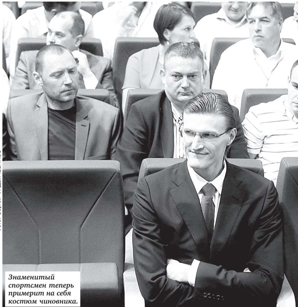
Знаменитый спортсмен теперь примерит на себя костюм чиновника.

Воспитанник СДЮШОР Фрунзенского района по баскетболу Кириленко — личность в чем-то легендарная уже при жизни. Недаром удостоен прозвища АК-47 — наподобие знаменитой модели автоматического оружия (за совпадение первых букв имени и фамилии с игровым номером). Во-первых,