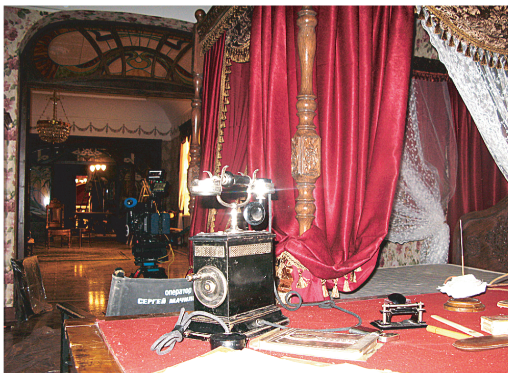
Декорации к фильму «Контрибуция» теперь можно увидеть в экспозиции киноцентра.