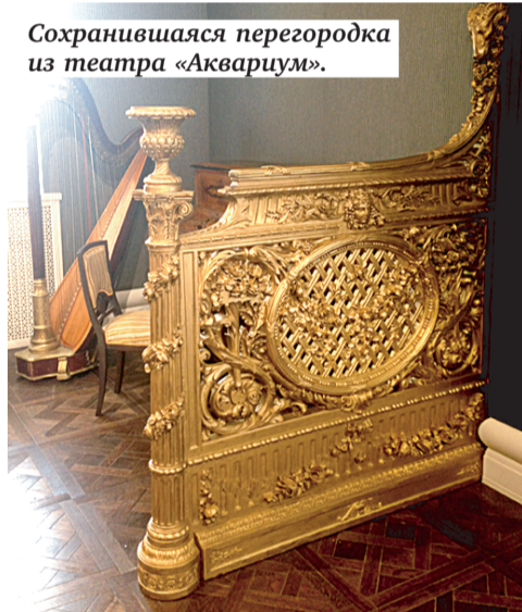
Сохранившаяся перегородка из театра «Аквариум».

С 28 АВГУСТА В КИНОТЕАТРЕ МОЖНО ПОСМОТРЕТЬ СЛЕДУЮЩИЕ ФИЛЬМЫ: