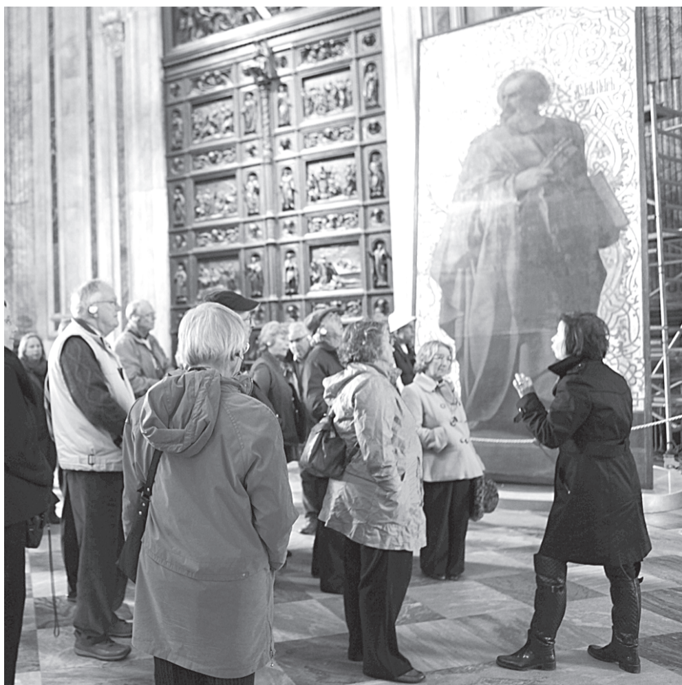
Экскурсии можно проводить и в музеях, и в храмах.