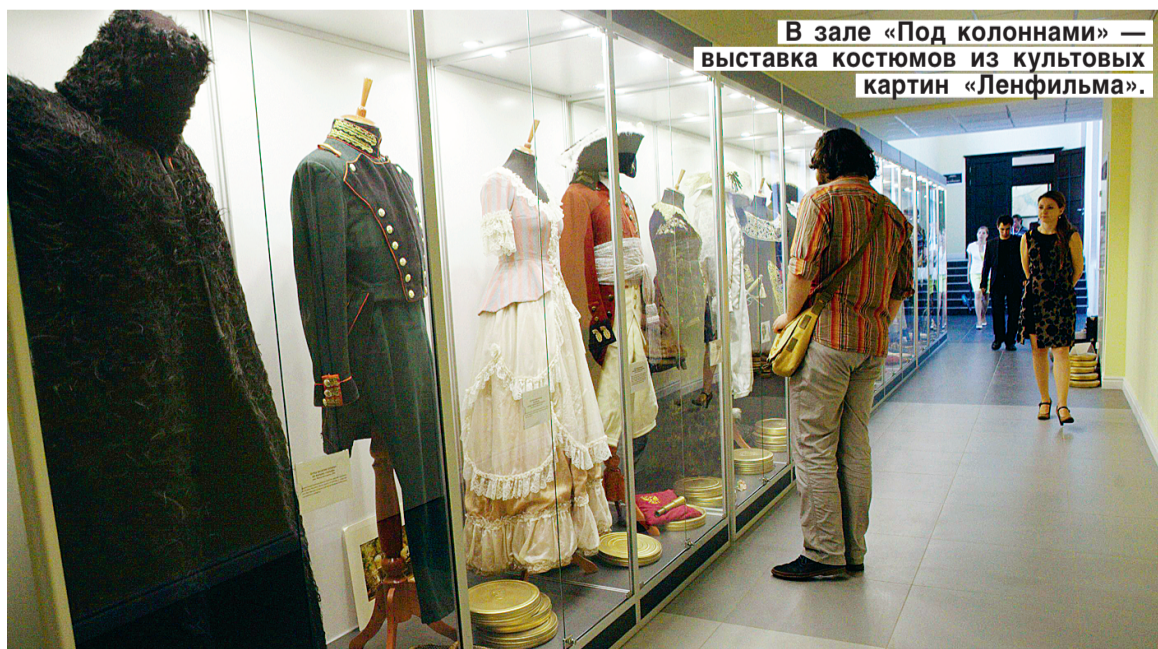
В зале «Под колоннами» — выставка костюмов из культовых картин «Ленфильма».