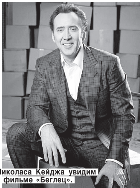
Николаса Кейджа увидим в фильме «Беглец».

Использованы материалы с сайта insidemovies.com . Перевод с английского Инги БЕРГМАН