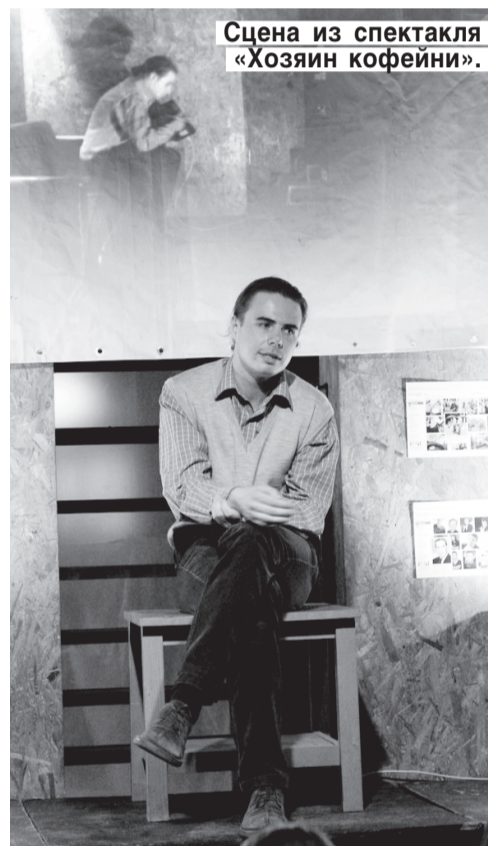
Сцена из спектакля «Хозяин кофейни».

последнюю по времени работу Ивана Вырыпаева «Спасение». Подробное расписание жизни пространства до 4 октября можно найти на сайте проекта popuptheatre.ru .