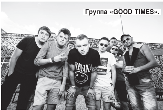
Группа «GOOD TIMES».