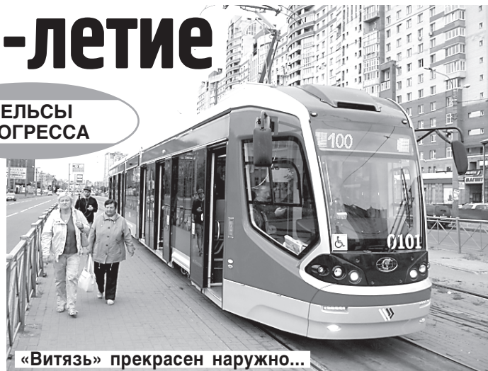
«Витязь» прекрасен снаружи...

Три новых низкопольных трамвая «Витязь» отечественного производства вышли 3 сентября на линию, чтобы возить пассажиров по маршруту №100. Символично, что сегодня сотрудники ГУП «Горэлектротранс» отмечают 135-летие со дня появления первого в мире трамвая, созданного российским инженером Федором Пирозским, который поставил на конку электродвигатель.