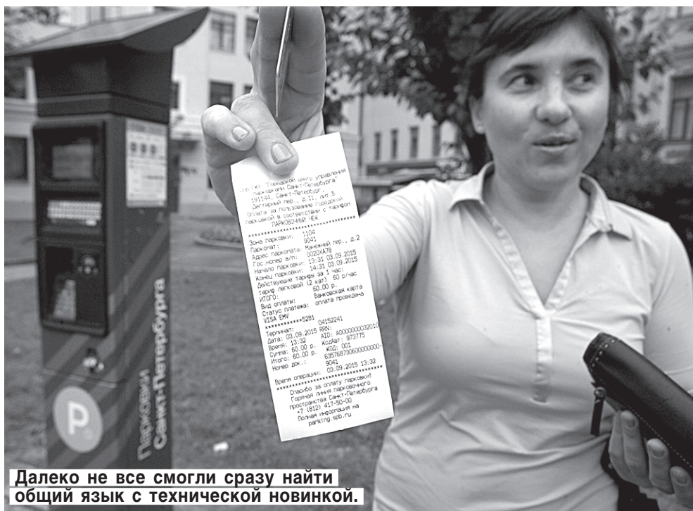
Далеко не все смогли сразу найти общий язык с технической новинкой.

— Я уже пыталась внести деньги на улице Маяковского, промучилась минут двадцать